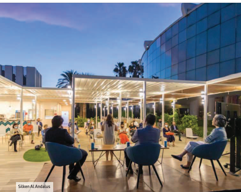
Silken Al Andalus

El Meliá Lebreros , en el barrio de Nervión, fue totalmente renovado en 2017. Tiene 429 habitaciones (53 con servicio The Level). Antes de la pandemia el restaurante Mosaico, con terraza climatizada, ofrecía el servicio All Day Dining.