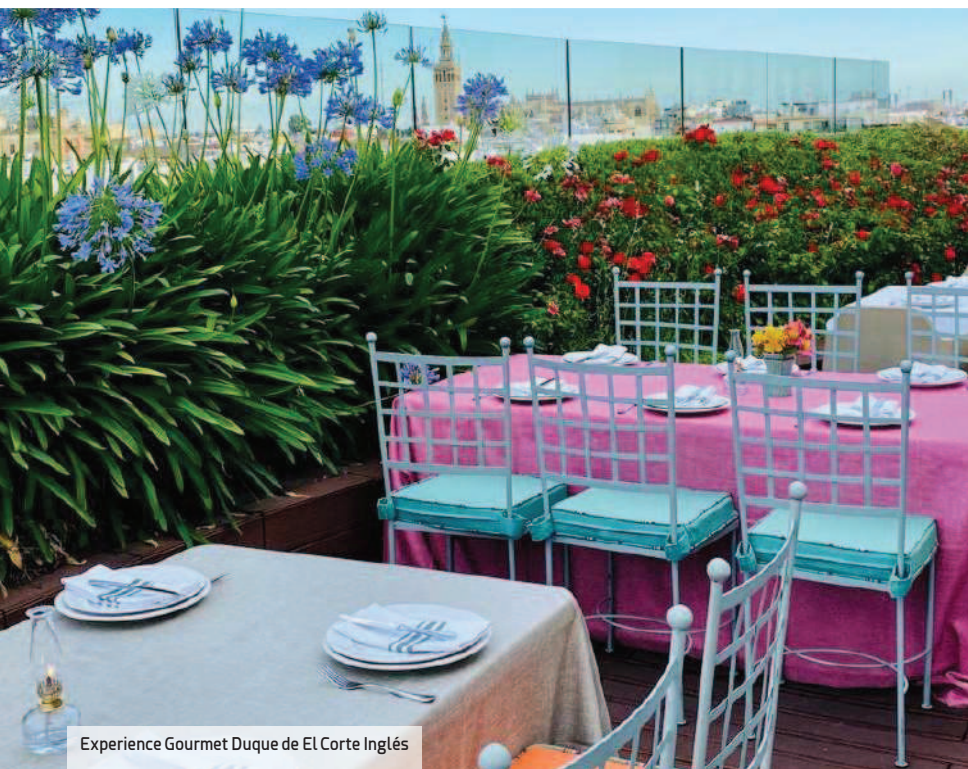
Experience Gourmet Duque de El Corte Inglés

El Museo de Bellas Artes es según los propios habitantes un gran desconocido. Reconocido como una de las grandes pinacotecas del mundo, aglutina interesantes obras de los siglos XVI, XVII y principios del XIX. Reúne además numerosos cuadros de Bartolomé Este-