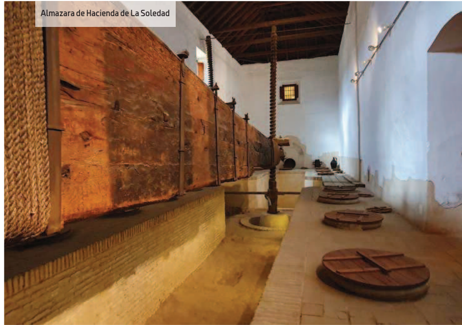
Almazara de Hacienda de La Soledad

jamón ibérico, de sus variedades de aceite, de sus recetas de invierno y verano... En la terraza Gourmet Experience Duque de El Corte Inglés , hasta 220 en cóctel pueden disfrutar de las vistas de la ciudad.