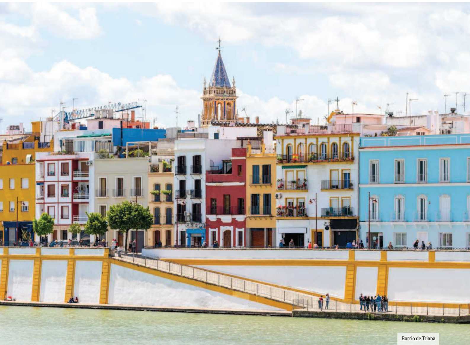
Barrio de Triana

Rivaliza con el centro histórico en cuanto a barrio con más personalidad de Sevilla. Triana es cuna de hermandades religiosas, de toreros de prestigio, de marineros famosos y hasta de muchos de quienes trabajaron en el Tribunal de la Inquisición que tuvo su sede en la ciudad durante 300